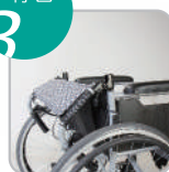
後彎關節便利收合 (SM-150.2)